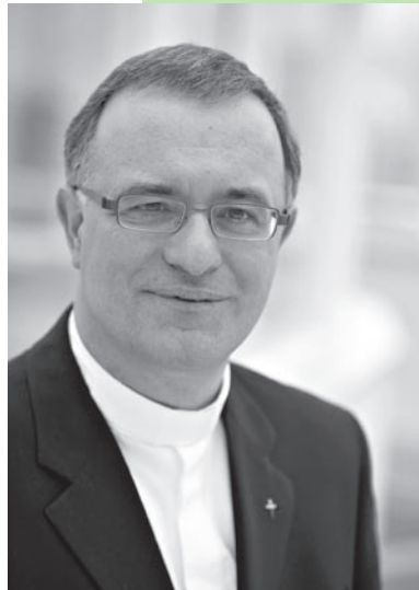
Landesbischof Dr. h.c. Frank Otfried July, Bischof der Evangelischen Landeskirche in Württemberg.