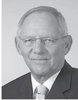
Dr. Wolfgang Schäuble.

Schäuble übt seit 2009 das Amt des Finanzministers aus. Zuvor war er Innenminister und in früheren Jahren Chef des Bundeskanzleramts. Er absolvierte