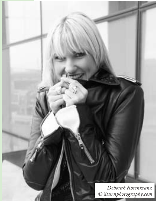
Déborah Rosenkranz

Cursar pedido del CD de las dos canciones de Rosenkranz a: Evangelisches Medienhaus, Augustenstr. 124, 70197 Stuttgart, Alemania; correo-e: info@evmedienhaus.de (Precio: 4,95 euros).