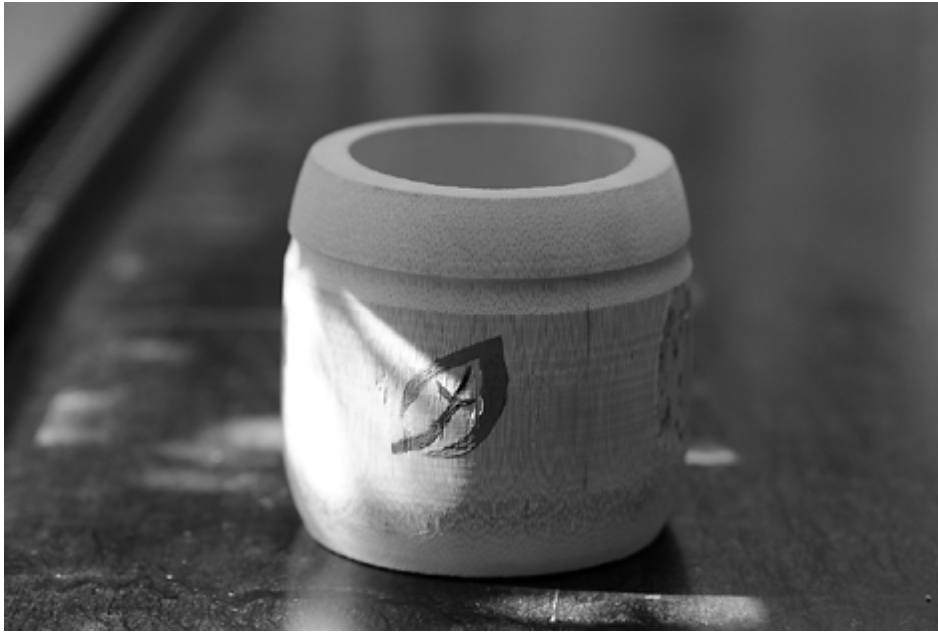
This bamboo bowl from Taiwan will be among the Lutheran communion gifts at the July 2010 Assembly.