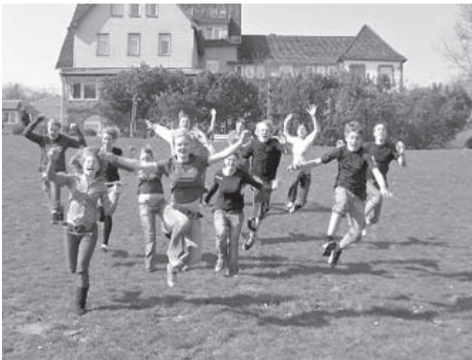
Konfirmandengruppe auf einer Konfirmandenzeit in Dassel im Kirchenkreis Leine-Solling im Süden Niedersachsens (Deutschland).

Au terme du programme de visites, les participant(e)s seront accompagné(e)s jusqu'à Stuttgart, où ils/elles arriveront à temps pour assister au service d'ouverture de l'Assemblée le 20 juillet. Les Églises d'Allemagne se réjouissent de la visite des membres de la communauté mondiale de la FLM.