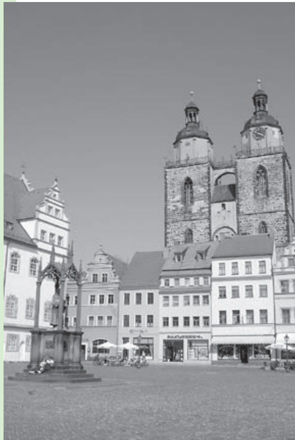
Marktplatz der Lutherstadt Wittenberg (Deutschland) mit Stadtkirche und Lutherdenkmal.

The sites to be visited include the Luther House, the Castle Church with the door on which the 95 Theses were nailed and the City Church ( Stadtkirche ). Guests will have the opportunity to discuss the church's situation in a context in which around 80 percent of the population no longer belongs to any faith community. That the remnant minority can nonetheless influence society is demonstrated by the church's decisive role in the 1989 "peaceful revolution." To commemorate the 500 th anniversary of the Reformation, a "Luther Garden" has been created in Wittenberg in which 500 trees will be planted. Churches from around the world are invited to sponsor a tree and at the same time plant one in their respective home congregations. In this way, a worldwide network of fellowship will be created by 2017.