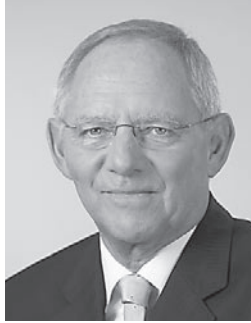
Dr. Wolfgang Schäuble.

Schäuble übt seit 2009 das Amt des Finanzministers aus. Zuvor war er Innenminister und in früheren Jahren Chef des Bundeskanzleramts. Er absolvierte