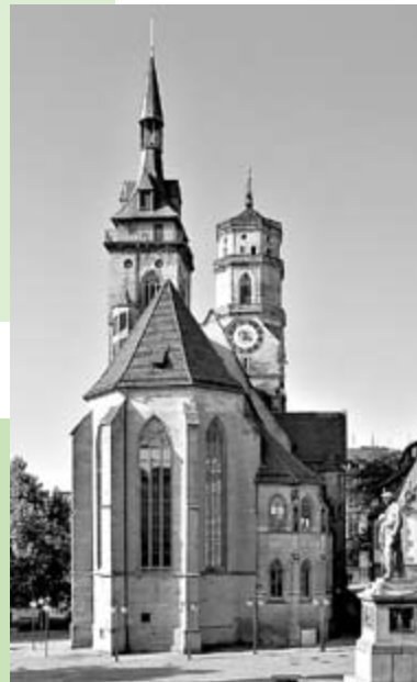
Stiftskirche in Stuttgart (Deutschland)