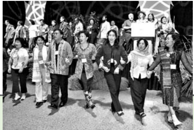
2003 Assembly participants

Las directrices sobre la asignación de delegados/as ante la Undécima Asamblea estipulan que haya al menos un/a representante de cada iglesia miembro de pleno derecho. De los/as 418 delegados/as, el 50 por ciento serán mujeres y el 20 por ciento, jóvenes (menores de 30 años).