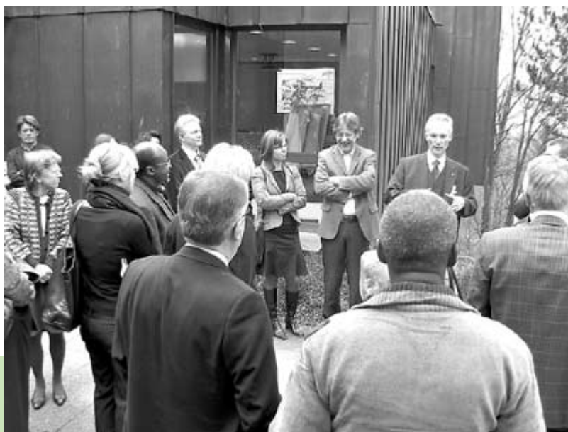
January 2008 Assembly Planning Committee meeting in Stuttgart, Germany