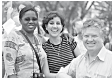
Participants in the 2003 Winnipeg Assembly

The assembly participants will include 418 delegates from the 138 full LWF member