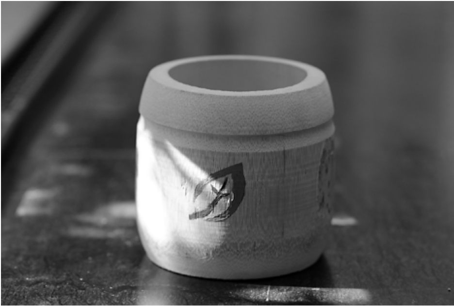
This bamboo bowl from Taiwan will be among the Lutheran communion gifts at the July 2010 Assembly.