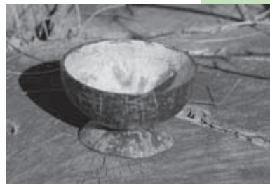
A sample of the Mozambican bowls to be shared at the Eleventh Assembly in Stuttgart, Germany.

To make the bowls, the empty coarse shell is soaked in water for 24 to 28 hours, and then scraped until smooth. It is cut proportionately with the upper wide side as the brim, and the lower smaller one as the base. Both portions are glued together and then polished and varnished to make the bowl. It can take four days to make one bowl, used in Mozambique for drinking and holding liquids.