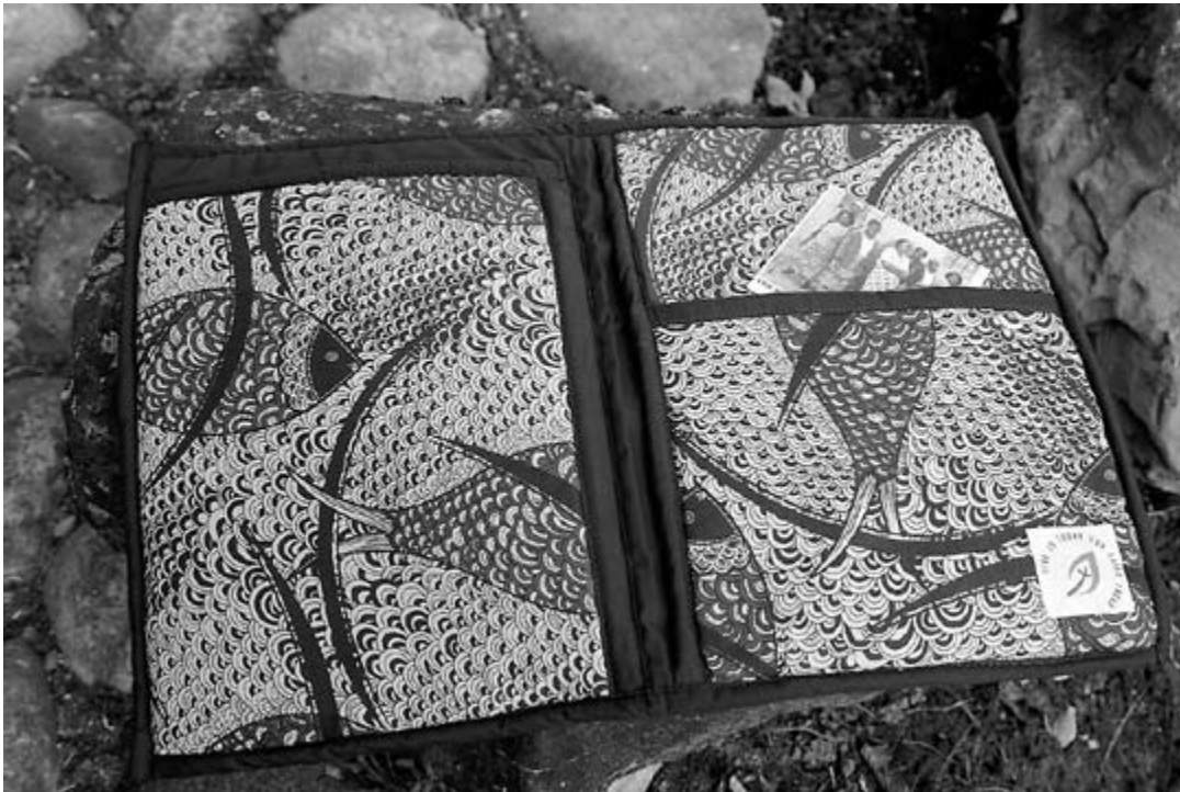
The Chamanculo Sewing group produced these document folders to be distributed at the Assembly.

In Mozambique, school children use such folders to carry books.