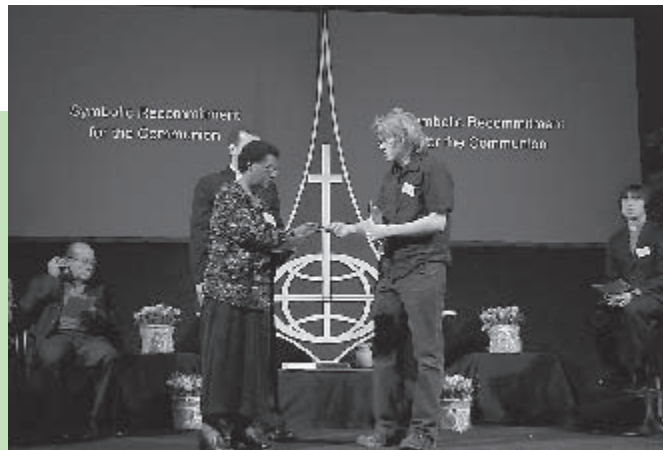
LWF church representatives share gifts from the Lutheran communion at the March 2007 LWF 60th anniversary celebrations in Lund, Sweden.

Kommen Sie mit offenen Augen nach Stuttgart und entdecken Sie die Gaben, die wir miteinander teilen!